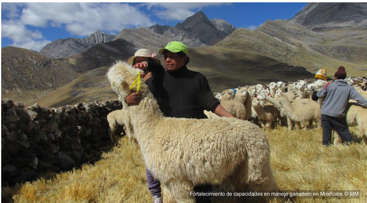
Fortalecimiento de capacidades en manejo ganadero en Miraflores