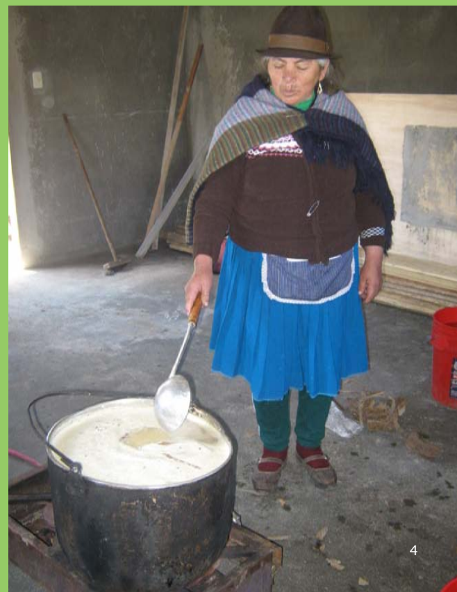
Ejemplos de manifestaciones culturales que podrían incluirse en una guía para caminantes: 1. Celebración de la fiesta del Inti Raymi en Juncal (Parque Nacional Sangay, Ecuador). 2. Fiesta de la Virgen del Carmen en Mapaguiña (Parque Nacional Sangay, Ecuador). 3. Mujeres de Tanta, en la Reserva Paisajística Nor Yauyos-Cochas en Perú, ofrecen una degustación de comidas y bebidas típicas. 4. Una señora muestra cómo se prepara la chicha de jora en Cochapamba (Parque Nacional Sangay, Ecuador).