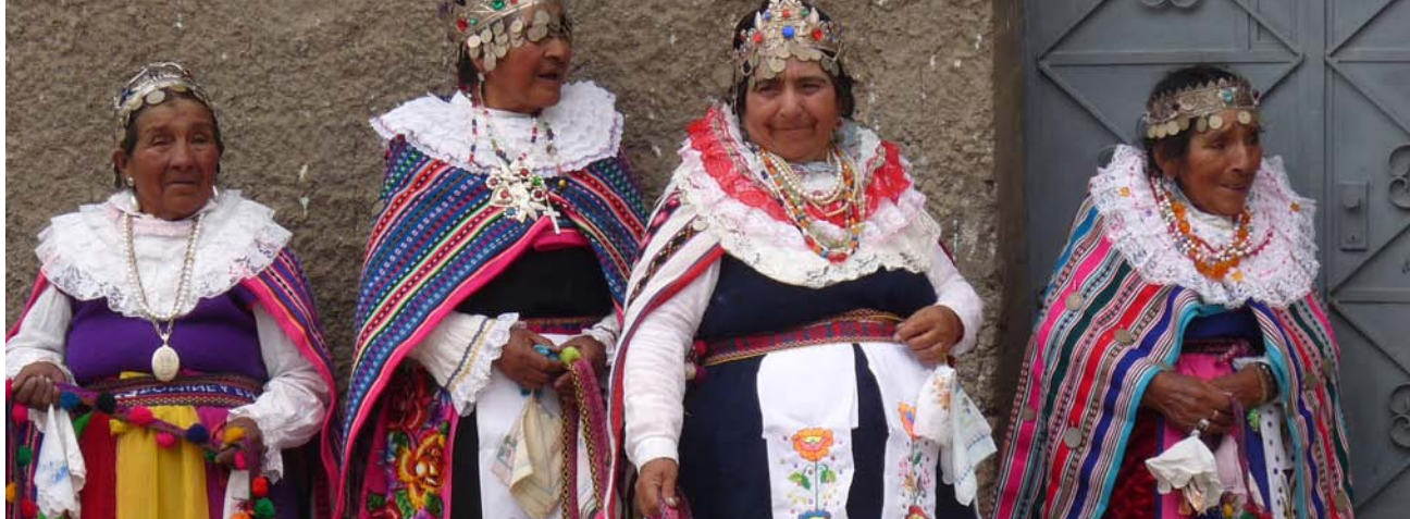
Celebración en la comunidad de Tanta, personificación de Los Ingas. Reserva Paisajística Nor Yauyos-Cochas.