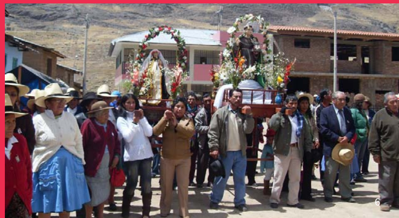
1. Danza. Reserva de Biosfera Huascarán. 2. Conocimientos sobre el uso de plantas medicinales. Lagunas Huaríngas. 3. Uso del telar a pedal. Reserva Paisajística Nor Yauyos-Cochas. 4. Festividad de la Virgen del Carmen en Mapaguiña. Parque Nacional Sangay. 5. Trueque de semillas. Comunidad Campesina de Vicos. 6. Procesión religiosa. Comunidad de Tanta.