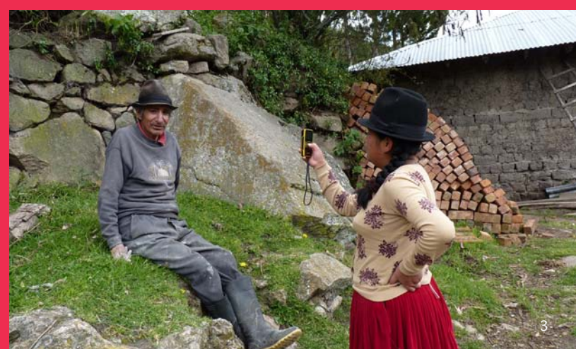
1. Reunión de representantes de la comunidad de Canrey, Parque Nacional Huacarán. 2. Facilitadores externos con un grupo de señoras de la comunidad de Tanta, Reserva Paisajística Nor Yauyos-Cochas. 3. Coinvestigadores entrevistando en Cochapampa, Parque Nacional Sangay.